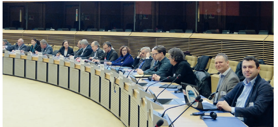
Des syndicats du transport de plusieurs pays européens ont posé de nombreuses questions critiques à la Commissaire européenne Bulc.