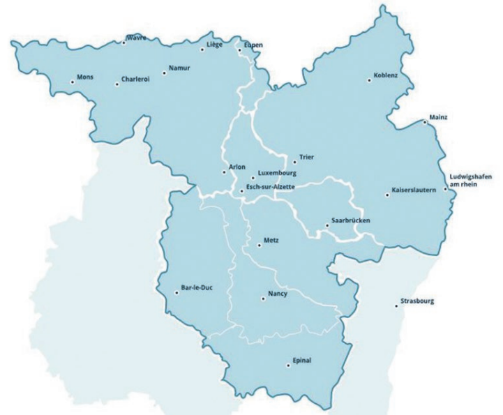
Le Conseil syndical interrégional (CSI) «Grande Région» couvre la Sarre, la Lorraine, le Grand-Duché du Luxembourg, la Rhénanie-Palatinat et la Wallonie.

La FGTB a maintenant une double collaboration transfrontalière avec